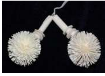
চিত্র নং: ২.মোটিফঃ কদম ফুল