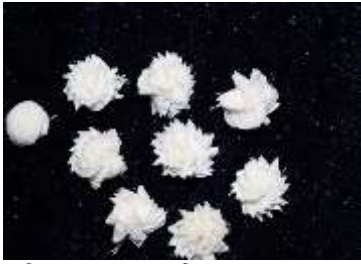
চিত্র নং: ১. মোটিফঃ গোলাপ ও জুঁই

মোটিফ - ২. লতা : শোলাশিল্পের ‘লতা’ একটি বিশেষ মোটিফ। তরঙ্গিত-পুষ্পিত-লতা, শঙ্খলতা বা সাধারণ লতা (রেখাচিত্র নং- ২) শোলা শিল্পদ্রব্যের মোটিফের একটি অন্যতম বৈশিষ্ট্য। সাধারণতঃ প্রতিমার আভরণ নির্মাণে এবং মণ্ডপসজ্জা, চালচিত্র নির্মাণে এই সব মোটিফের প্রাধান্য লক্ষ্য করা যায়।