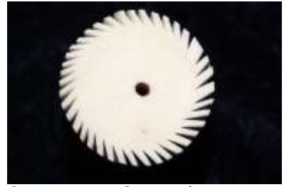
চিত্র নং: .৩.মোটিফঃ সূর্য/নক্ষত্র/ বৃত্ত

মোটিফ - ৩. সূর্য : শোলাশিল্পের একটি অন্যতম মোটিফ হল সূর্য (চিত্র নংঃ ৩)। সাধারণতঃ বিবাহের টোপরে, দেবদেবীর মুকুটে এবং দেবদেবীর মূর্তির পিছনের চালায় সূর্যাকৃতি ছটা নির্মাণের জন্য এই মোটিফের ব্যবহার করা হয়। শোলাশিল্পের উৎপাদিত বিভিন্ন দ্রব্যের মধ্যে কখনও সূর্যের পূর্ণ বা অর্ধ-রূপ (রেখাচিত্র নং- ৩) দেখা যায়।