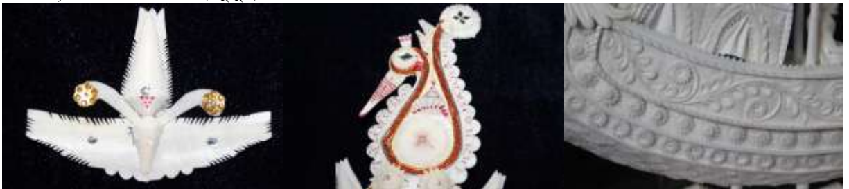
চিত্র নং: ৪. মোটিফঃ প্রজাপতি

মোটিফ - ১২. প্রজাপতি : শোলাশিল্পের অপর একটি উল্লেখযোগ্য মোটিফ হল প্রজাপতি (রেখাচিত্র নং- ১২) (চিত্র নংঃ ৪)। সাধারণতঃ টোপর, মুকুট, সিঁথিমোড় ও মণ্ডপসজ্জায় এই মোটিফটির ব্যবহারের আধিক্য লক্ষ্য করা যায়।